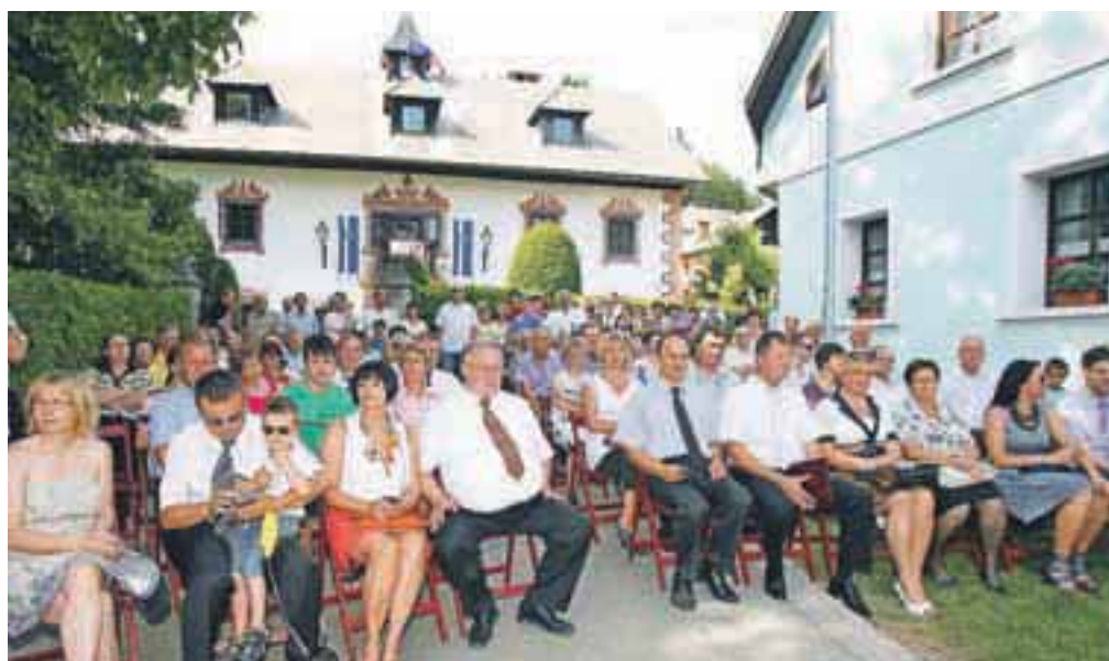
Slavnostna seja občinskega sveta občine Naklo pred graščino Duplje z gosti