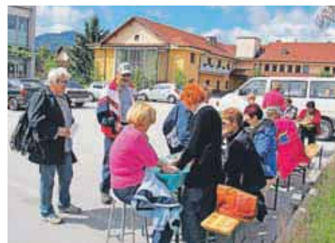
VSAKEMU UDELEŽENCU SO NAJPRED IZMERILI KRVNI TLAK.