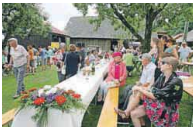
Dogodek Na vasi se dogaja je tudi pred gasilski dom v Podbrezje privabil številne obiskovalce.