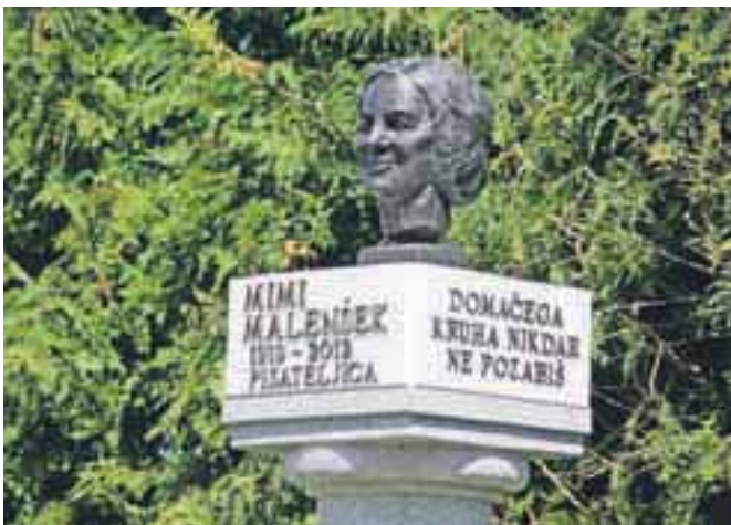
Doprski kip v poklon pisateljici.