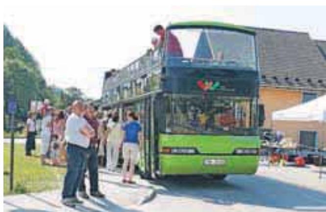
Panoramski avtobus Veseli Janez je s krožno vožnjo povezal kraje v občini Naklo.