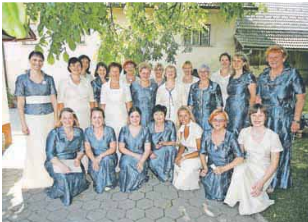
Ženski pevski zbor Dupljanke