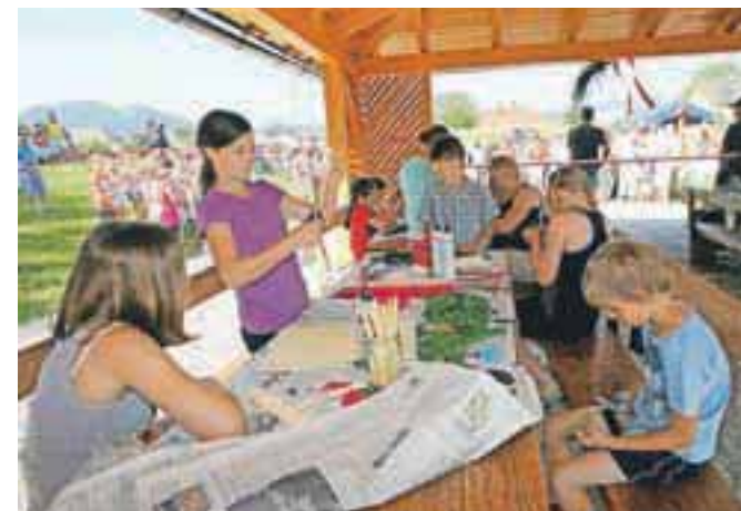
Drugačno, dinamično in raznoliko je izvajanje pouka na prostem.