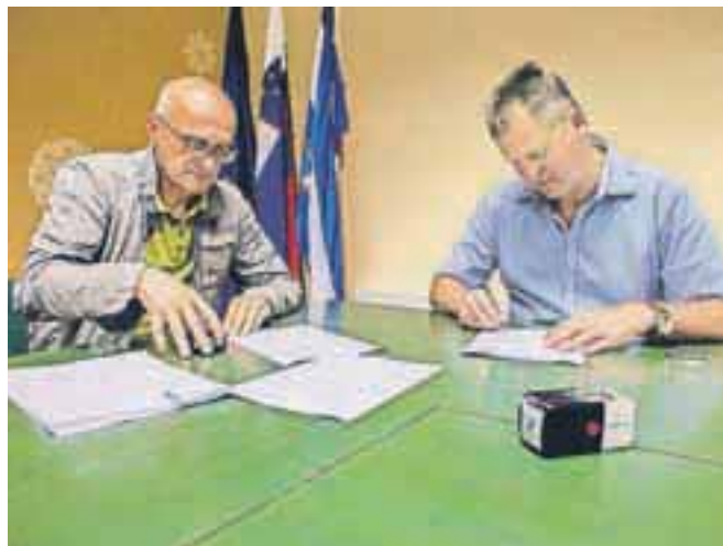
Podpis pogodbe z izbranim izvajalcem del, podjetjem Adaptacije – Vzdrževanje Ljubljana.

Podbrezje – Energetska sanacija šole v Podbrezjah delno financira Evropska unija iz kohezijskega sklada. Investicija se izvaja v okviru Operativnega programa razvoja okoljske in prometne infrastrukture za obdobje 2007–2013, razvojne prioritete »Trajnostna raba energije«, prednostne usmeritve »Energetska sanacija javnih stavb«. Iz tega razpisa so bila občini Naklo zagotovljena sredstva v višini 183 tisoč evrov. Prenovili bodo kotlovnico z zalogovnikom na lesno biomaso, obnovili bodo fasado in podstrešje, zamenjali razsvetlavo in radiatorске razvođe v objektu. Nekaj bo tudi splošnih vzdrževal-