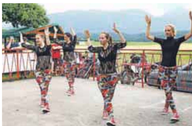
V Podbrezjah je bilo veselo pri gasilskem domu. Nastopila so tudi dekleta iz Plesnega studia Špela.