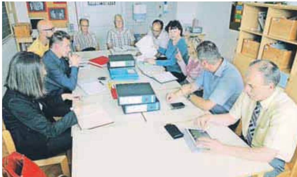
Uvedba v delo za izvedbo del v šoli in vrtcu v Dupljah

Na severnem delu bodo objekt prizidali in nadzidali. »Šola in vrtec bosta pridobila nove kletne prostore: kotlovnico, shrambo, arhiv, pralnico in šivalnico ter garderobe. V pritličju bo za potrebe kuhinje zgrajen prizidek na dvoriščni strani vrtca. Pridobljeni prostori bodo namenjeni novi razdelitvi kuhinji, dosedanjim garderobnim prostorom šole pa bodo postali jedilnica. Na dvoriščni strani šole bo prizidan nov nadstrešek, vhod v objekt bo prestavljen v prostor knjižnice, garderobni prostori bodo na mestu sedanje kuhinje. V nadstropju bo na novo nadzidana etaža, kjer bodo urejene sanitarije in nova učilnica. Urejen bo dostop na podstrešje, zgrajena nova medetažna plošča, lesena strešna konstrukcija pa bo nadomeščena z novo jekleno. Podstrešje bo tako pripravljeno na prenavo in