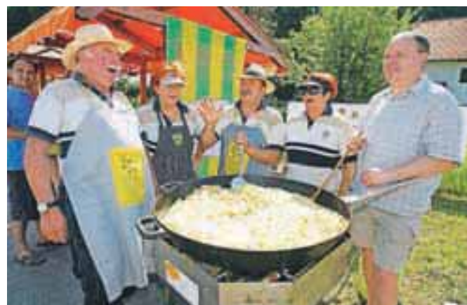
Člani Društva za priznanje praženega krompirja kot samostojne jedi in obenem tudi člani Turističnega društva Naklo so postregli s čez sto porcijami praženega krompirja.