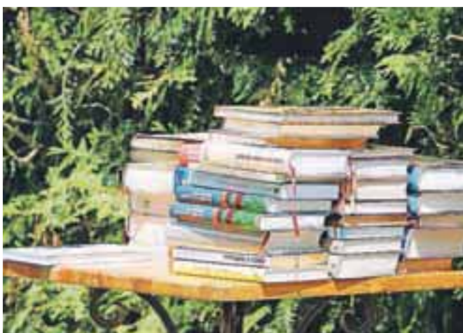
Na mizi ob kipu so ždele njene knjige, dediščina, ki jo je zapustila domačemu kulturnemu društvu. 33 njenih avtorskih del in 22 prevodov. Molče so čakale. Iz njih so na ta dan brali.