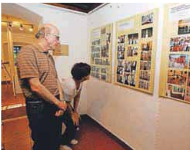
Ob jubileju so odprli razstavo fotografij najbolj odmevnih dogodkov.