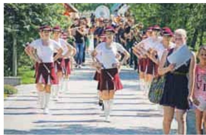
Mažoretke so spremljale godbo na pihala tik pred začetkom slavnostne seje v Dupljah.