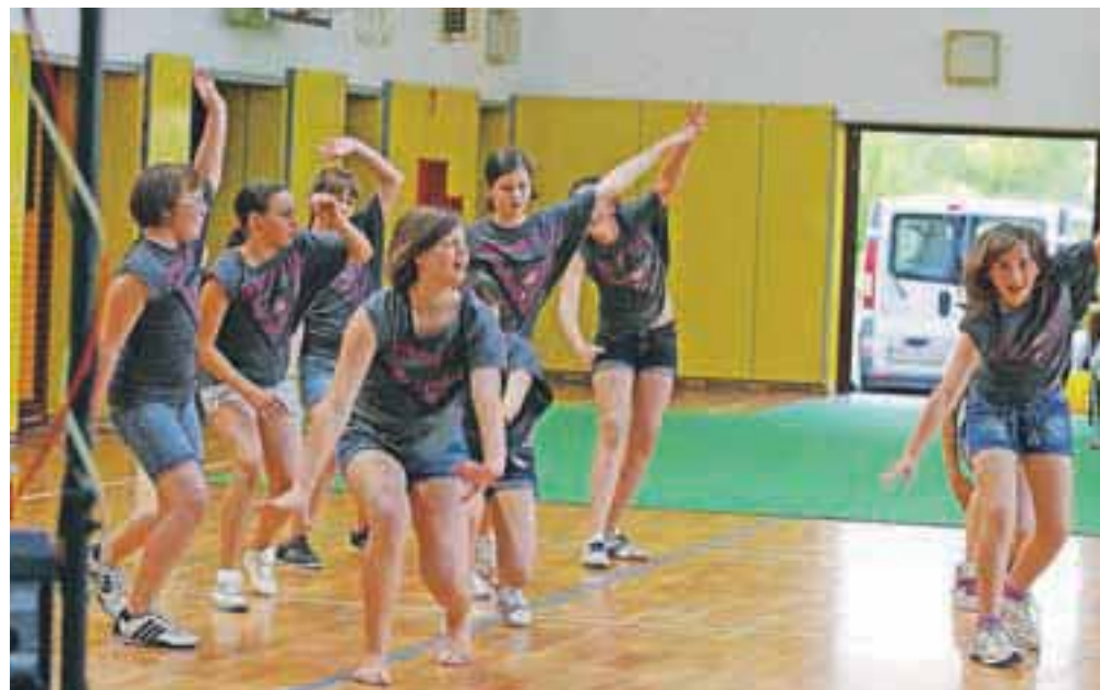
Skokice iz OŠ Naklo ... nastop za vse babice in dedke