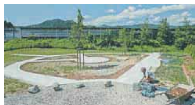
NA CEGELNICI SE ŽE KAŽEJO ZAMETKI MANJŠE UREJENE PARKOVNE POKRŠINE.