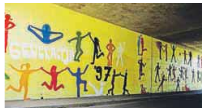
IZVIREN SPOMIN NA GENERACIJO DEVETOŠOLCEV

Letošnja in že lanska generacija devetošolcev OŠ Naklo je svoj pečat pustila v podhodu med Cegelnico in Naklim. Mladi so s pisanimi barvami na svoj način porisali stene podhoda in jih naredili zanimive za mimoidoče. Na del njihove mladosti bo lep spomin vsakič, ko bo pot vodila iz Cegelnice v Naklo in obratno. Poleg tega na Cegelnici občina že ureja parkovno površino. S. K.