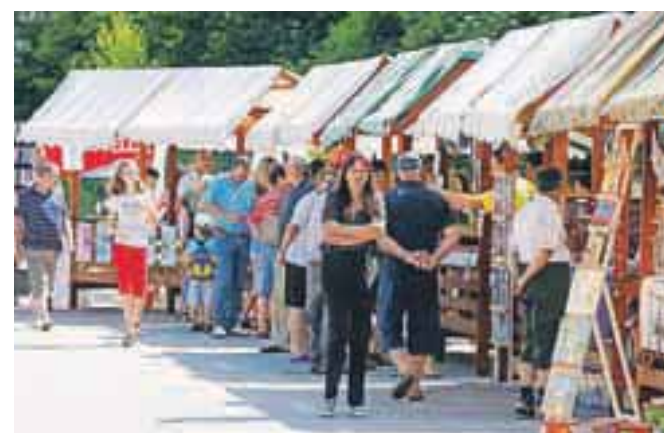
Stojnice v Naklem, Podbrezjah in v Dupljah so bile odlična priložnost za predstavitev domačih obrtnikov, društev...